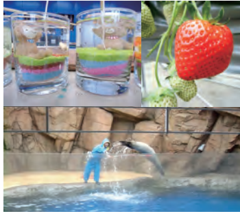
運命の告白タイム♥

当日はあいにくの曇り空でしたが、ゆうひパークでの自己紹介にはじまり、こども美術館でのキャンドル作り、ベリーネでのいちご狩り、アークスでの観覧、ゆうひパークに戻つての懇親会と告白タイムまで、予定していたイベントを滞りなく終えることができました。中でも、ベリーネでの練乳を手に入れるために繰り広げられた、いちごを百グラムに調整する「ピタリイチゴ」は、大いに盛り上がりました。最後はねるとん方式による告白タイムを設け、男性参加者全員に女性の前に立って(友達からと