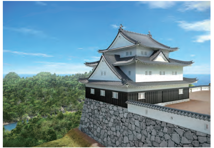
浜田城天守(三重櫓)復元CG (復元：三浦正幸 制作：株式会社エス)

築城当時、天守は入母屋の屋根を用いずに、1階から上階に向かって均等に建物が小さくして載せる新式の層塔型天守が主流でしたが、浜田城の場合、古い建築法である望楼型天守を建てていることや、1階の大きさに対して高さが14mと低いことなど、古式で重厚な外観を持たせた天守といえます。(文責：浜田商工会議所)