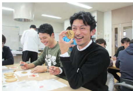
料理教室にて、スイーツ作りを楽しむYEGメンバー

来年度の石見四市交流会は、浜田が主管となります。我々も今回の大田YEGの皆様には、お返しを兼ねて、企画してまいります。大田YEGの皆様、この度は大変お世話になりました。