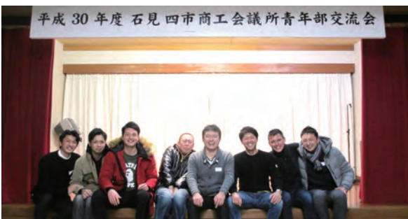
石見四市YEG交流会に参加した浜田YEGメンバー