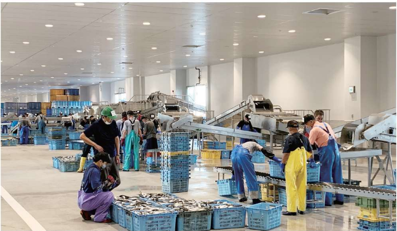
アジ、サバなどを選別機でサイズ選別した後、魚種ごとに手選別している様子

浜田市が約3.5億円をかけて整備した、水産物の競りなどをする「高度衛生管理型7号荷さばき所」が完成し、8月10日からの試験運用を終え、本格稼働しています。