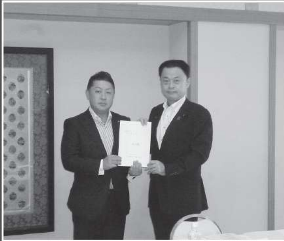
松江商工会議所 田部会頭(左)から丸山知事(右)へ要望書を提出