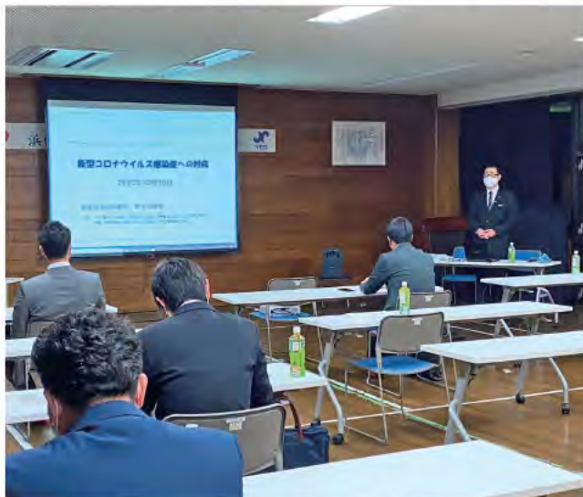
杖田委員長からの説明を熱心に聞き入る青年部メンバー