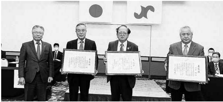
左から、樋山会頭、石田常議員、吉田副会頭、河野常議員