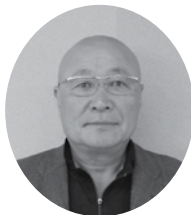
城市 正人 城市商店