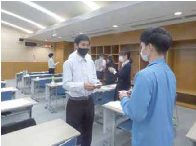
名刺交換を練習する会員企業の新入社員たち