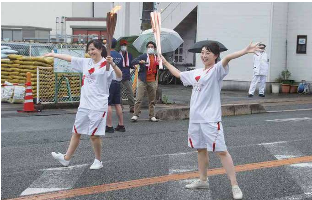
トーチを片手にポーズをとる聖火ランナーたち

令和3年5月15日(土)、東京五輪2020年大会の先駆けとして、市内で聖火リレーが行われました。リレーは浜田港公設市場前(原井町)から市役所前(殿町)の2.6キロをコースとし、12人のランナーたちは観客に見守られながら途中手を振るなどエールに応え、堂々と力走しました。