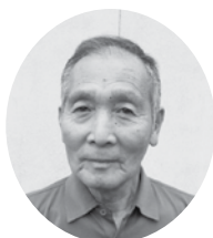
那田 實身 なだのや魚政