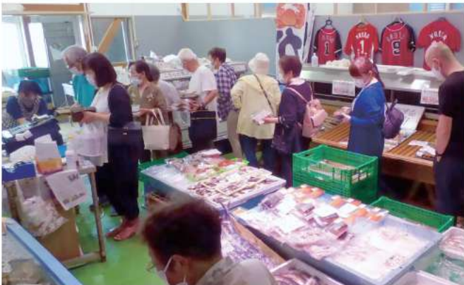
活況を呈する仲買棟