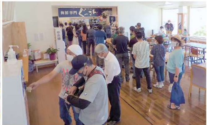
フードコートに押し寄せる客