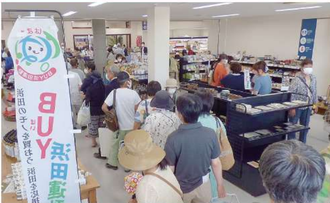
商業棟で地元産品を買い求める客