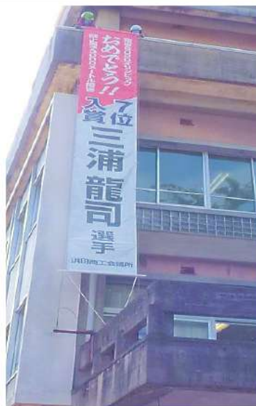
お披露目された懸垂幕