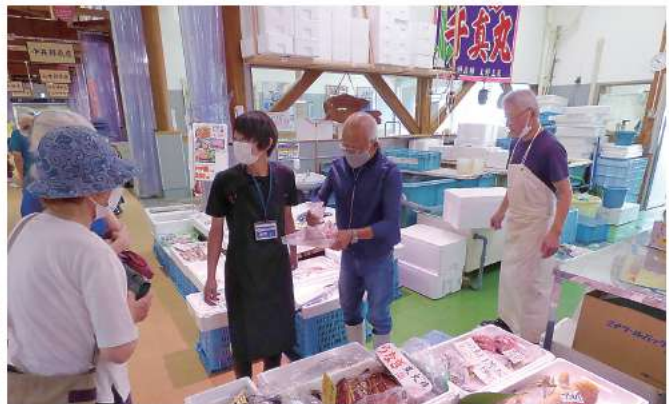
仲買棟で鮮魚を買い求める客

令和3年7月22日(木)、浜田漁港近くのはまだお魚市場(指定管理者:第一ビル)がグランドオープンし、この日を心待ちにしていた市民約3,500人が、三密を避けながら地魚や加工食品などを買い求めていました。