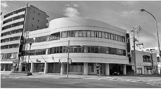
会館の移転先として検討している旧福屋浜田店