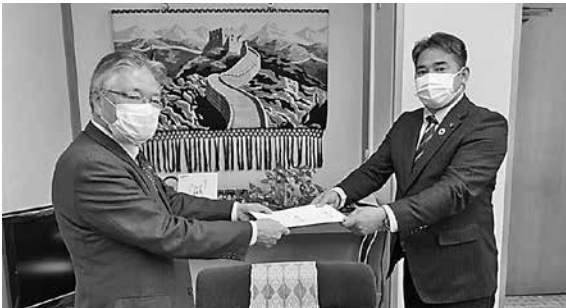
植山会頭から笹田議長(右)に要望書を提出