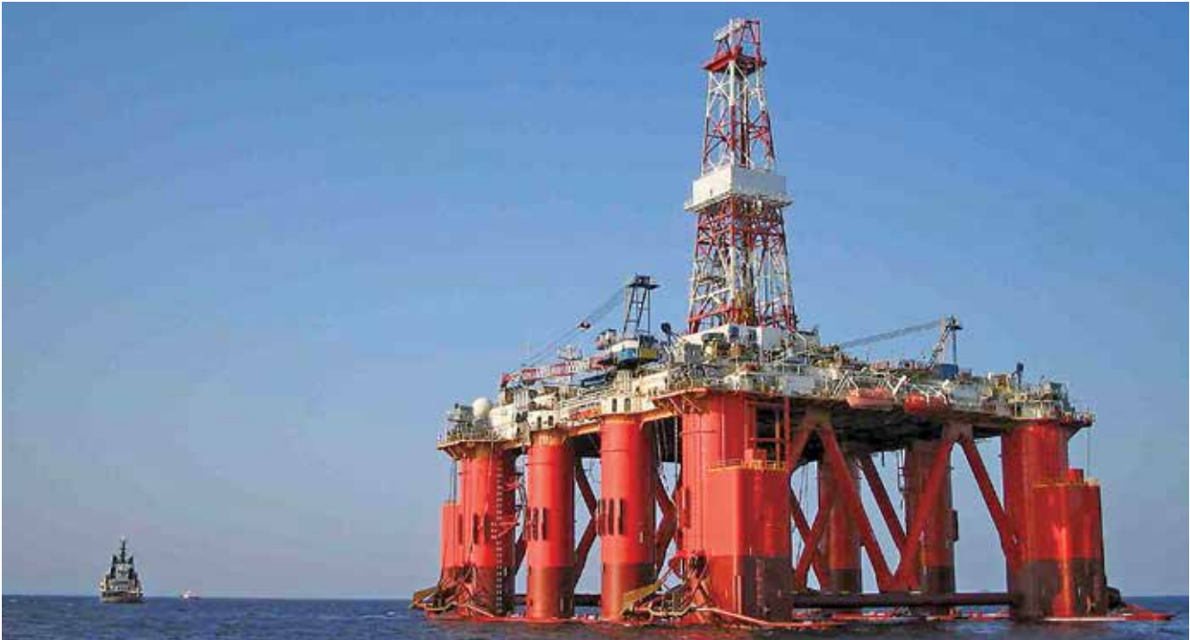
今回の浜田沖で使用予定の掘削リグ（第五白竜） 全長／全幅／全高：106m/79m/37.5m 定員：150名

大手石油開発企業の株式会社 INPEX（本社：東京都）は令和4年1月17日、浜田市北西約130キロの沖合で石油及び天然ガスの商業化できる埋蔵量があるか確認するための試掘調査を3月から作業開始すると発表。