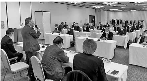
臨時常議員会開催 (2月24日)

として学生と高校生、市民、会員との交流が促進され、ひいては県大学生の想いや夢が果たせる魅力ある企業との出合いの場として、更にはIT人材と地域の若者との交流の場として提供したいと考えている。その実現には浜田市の協力・支援が是非とも必要で、一緒になって取り組んでいきたい。