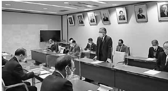
市長へ要望主旨について説明する植山会頭(中央)