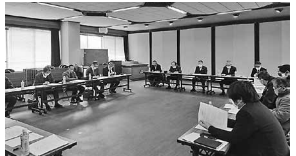
総務・21世紀まちづくり合同委員会 (2月7日)

これまで建替えを想定する中で積立等自己資金の準備・検討を進めてきたが、新会館の整備には