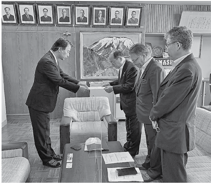
平野校長へ要請文を提出：浜田商業高等学校

コロナ禍により、地元で働きたいと考える生徒も増加傾向にあり、若者の地元定着が期待されています。