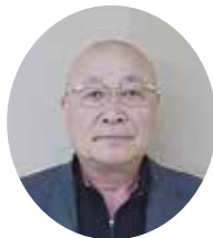
城市 正人 城市商店