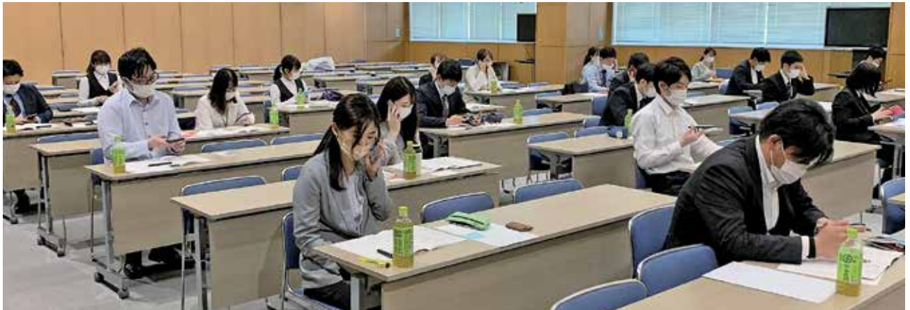
自身の携帯電話の録音機能を使いビジネス電話対応マナーを学ぶ受講者：いわみーる

令和4年5月18日(水)、浜田商工会議所主催(企画：庶業サービス部会)による「新入社員研修講座」がいわみーる(野原町)で開催され、市内9事業所から新入社員ら24人が受講しました。