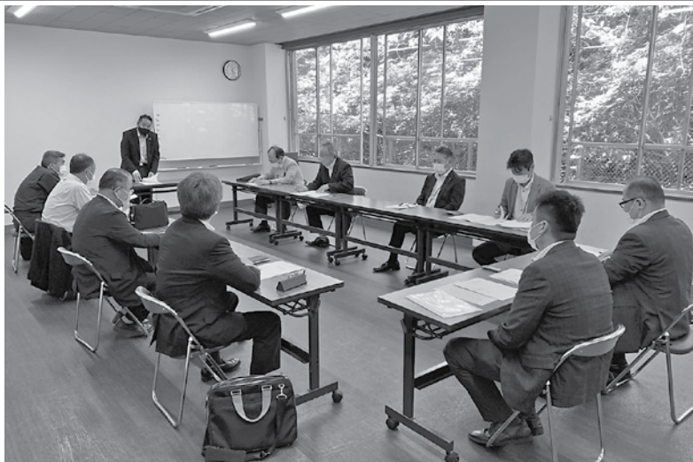
8名の委員で今後の取り組みについて協議