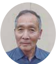
那田 實身 なだのや魚政