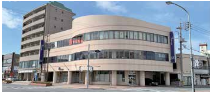
会館移転先の旧福屋浜田店