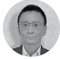
東洋証券(株) 浜田支店 支店長