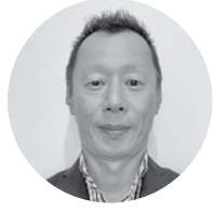
(株)かみのや 代表取締役