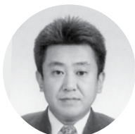
㈲高橋写真館 代表取締役