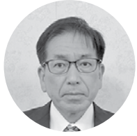
マルハマ食品(株) 代表取締役