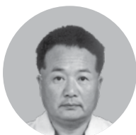
藤田緑化産業㈱ 代表取締役