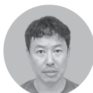
㈲山本一枝商店 代表取締役