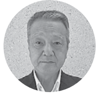
島根さんれい(株) 代表取締役