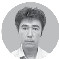
㈱中山工務店 代表取締役