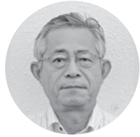
(株)第一ホーム 代表取締役