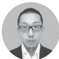
㈱魚勝商店 専務取締役