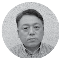
山陰中央新報浜田西部販売所 代表