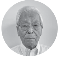
一般社団法人石炭物流団地協議会 会長