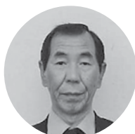
三浦司法書士事務所 代表