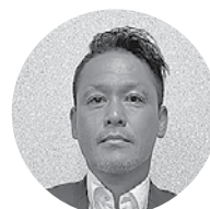
㈱西元屋 代表取締役