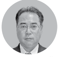
(有)クボタ牛乳 代表取締役