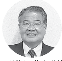
レディスワールド 代表