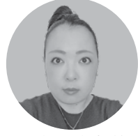
(株)オーブンハート フェリーチエ支配人