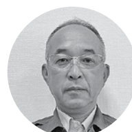
㈱中電工 浜田営業所 所長