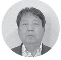
(株)西部生コン 代表取締役