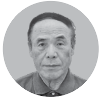
浜田共同水産加工業協同組合 理事長