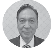
浜田市特産品協会 理事