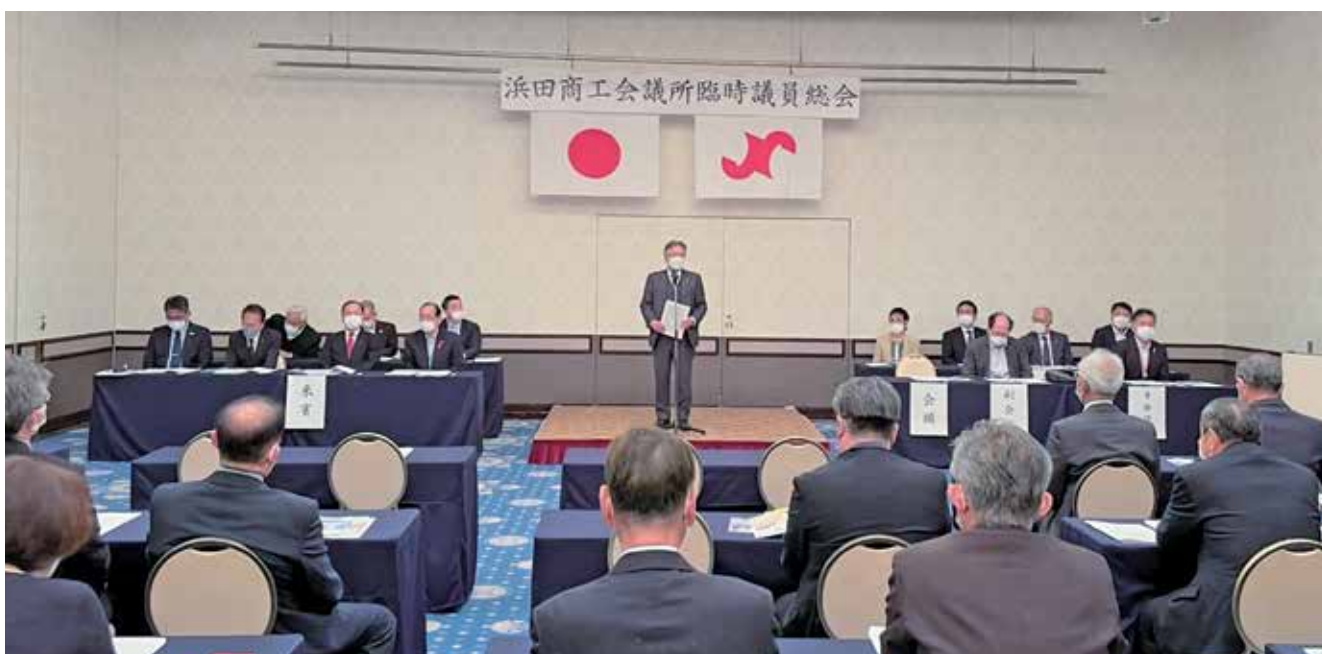
開会のあいさつを述べる樫山会頭(中央)

当所は10月28日、浜田ワシントンホテルにおいて臨時議員総会を開催し、議員・役員を決定しました。