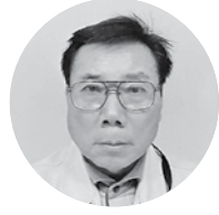
阿郷建設(有) 代表取締役