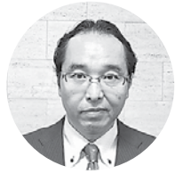
中国ウインドパワー(株) 代表取締役