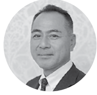
(有)岩永モーターズ 代表取締役