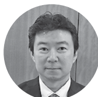
㈲鈴蘭別館 代表取締役