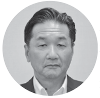
(株)山陰中央新報社 西部本社 専務取締役・西部本社代表