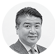
㈱ケイ・エフ・ジー 代表取締役