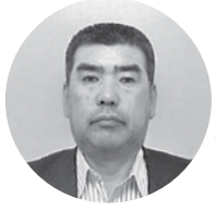
(株)ハゼヤマ 代表取締役