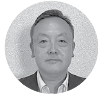
島根益田信用組合 浜田支店 支店長