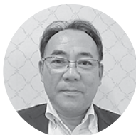
島根電工㈱ 西部支店 西部支店長