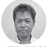
(有)浜田レンタリース 専務取締役