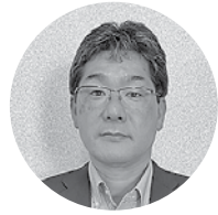
日本海信用金庫 常勤理事・本店営業部長・西支店長