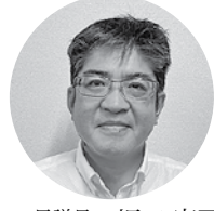
石見交通(株) 浜田営業所 所長