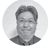
(有)おおさき内装 代表取締役