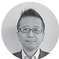
近重勉税理士事務所 所長