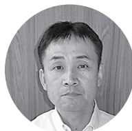
㈱コーヒン商会 代表取締役