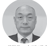
(有)吉寅商店 代表取締役