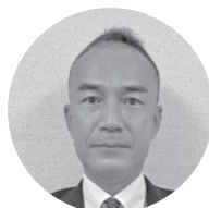
浜田小野田レミコン㈱ 代表取締役