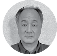
(株)島根銀行 浜田支店 支店長