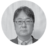
アクサ生命保険(株) 山陰支社 支社長