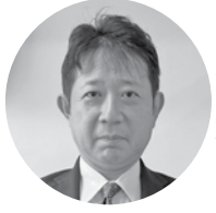
(株)浜昭 代表取締役