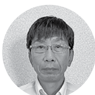
島根県農業協同組合 いわみ中央地区本部浜田支店 支店長