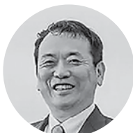
㈱タカハシ包装センター 代表取締役