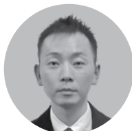
㈱キヌヤ 常務取締役