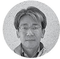
イワタニ島根(株) 代表取締役社長