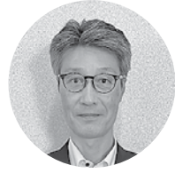
A L S O Kあさひ播磨(株) 代表取締役社長