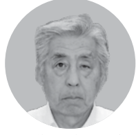
三和商事(株) 代表取締役