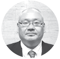
南和田商店 代表取締役