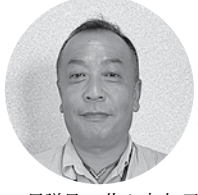
浜田ビルメンテナンス(株) 専務取締役