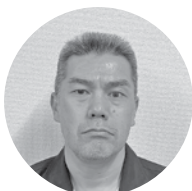
那賀運送㈲ 専務取締役