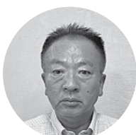
森口商事㈱ 代表取締役