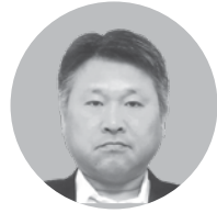
宮田建設工業(株) 代表取締役