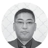
㈲大秀商店 代表取締役