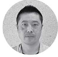
(株)石田弥太郎商店 代表取締役社長