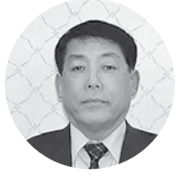
(株)エビス 代表取締役