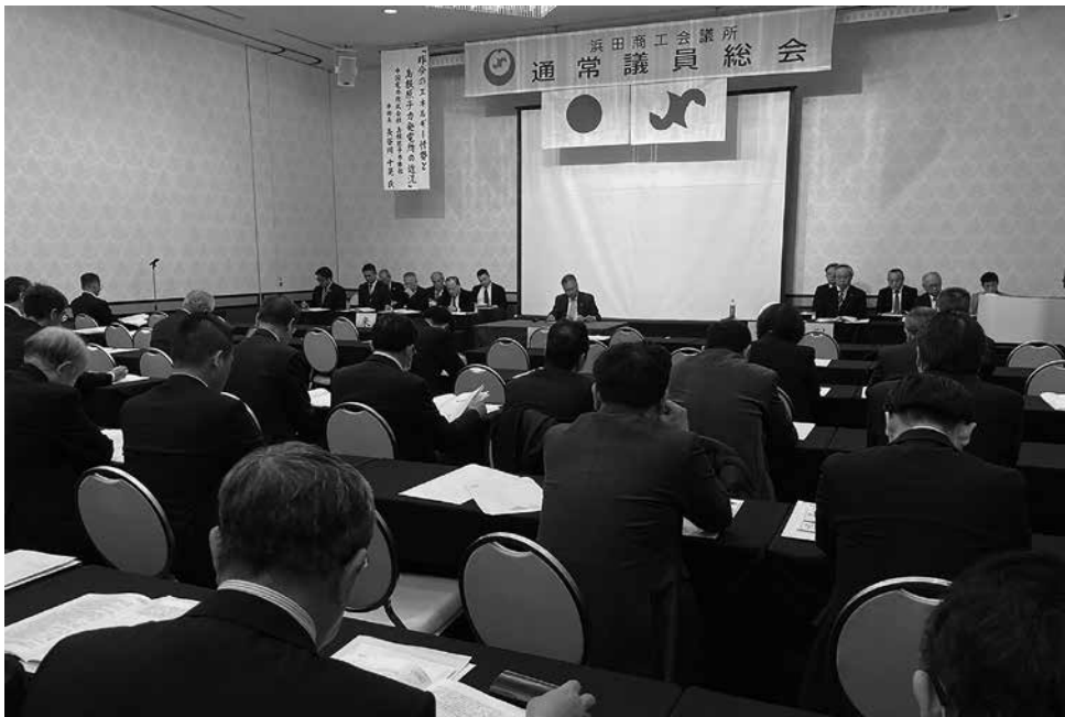
議案を審議する議員と執行部

第178回通常議員総会 シホテルプラザにおいて多 は3月26日、浜田ワシント 数のご来賓出席のもと、総