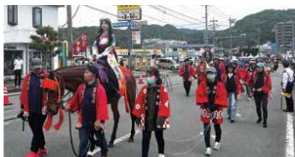
◀大名行列の様子(姫様と殿様)

また、パレードコース途中の宿場町に見立てた4商店街(新町・紺屋町・朝日町・銀天街)では「市民の楽市」が11時から16時半まで開催。