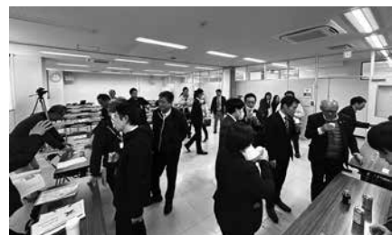
▲メディア取材、参加者同士交流の様子