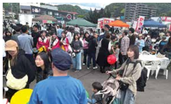
◀銀天街楽市の賑わい

特に三櫻酒造跡地を活用して開催された銀天街の楽市では、浜田市と「驛鈴協定」を結んでいる松坂市のPRブースが出展し、地元産品である松坂牛や松坂茶が提供され、パレードコース終盤の楽市として大きな賑わいの一つとして花を添えていました。