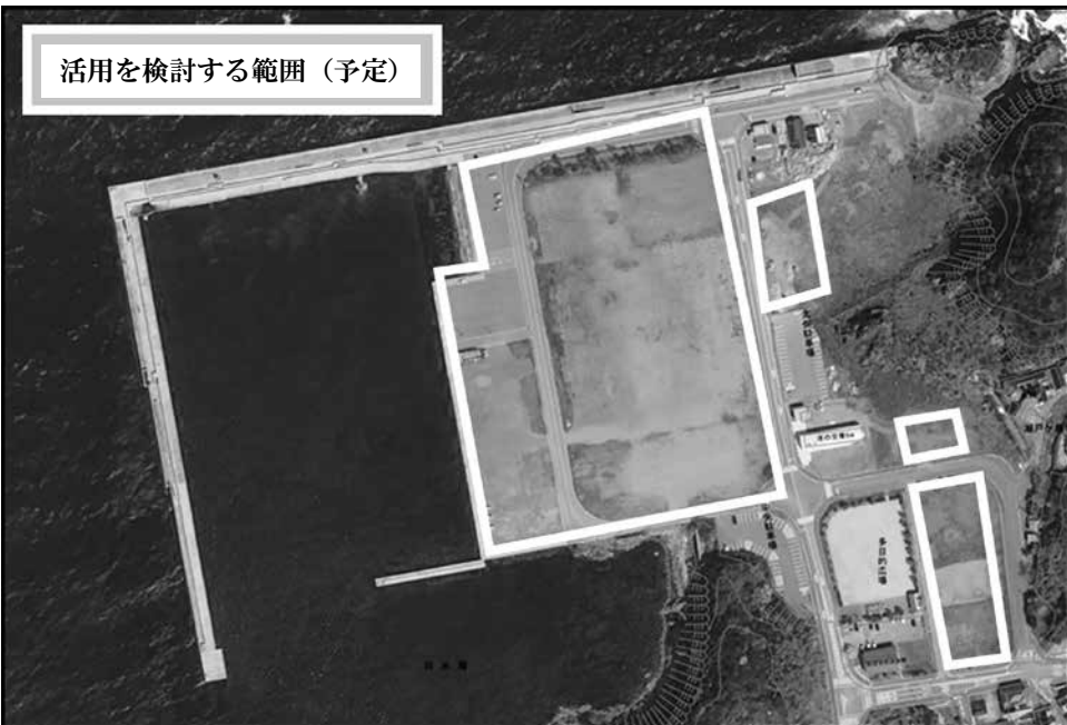
▲陸上養殖事業候補地(瀬戸ヶ島埋立地約4.0ヘクタール)