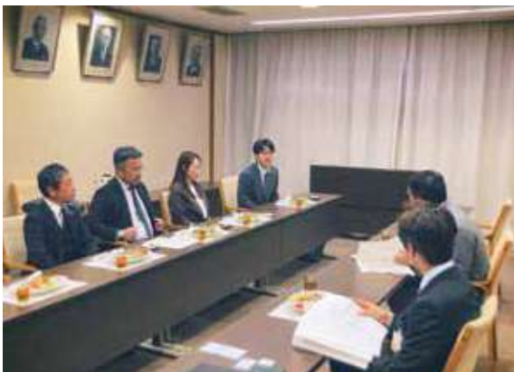
◀ 浜田市と意見交換をする新正副会長一同

今回の表敬訪問を通じて、地域の課題解決や活性化に向けて、行政と連携しながら取り組んでいくことの大切さを改めて認識いたしました。いただいた期待に応えられるよう、青年部一丸となって積極的に活動を展開してまいります。