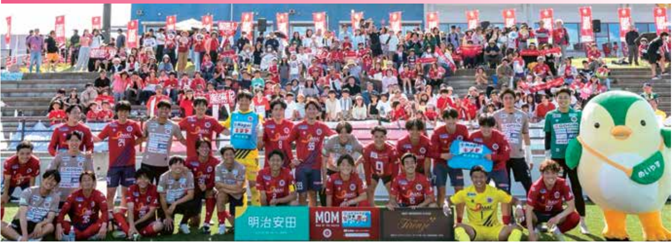
▲サポーターと勝利後の記念撮影

令和8年5月24日(日)、サン・ビレッジ浜田にて中国サッカーリーグ(CSL)第7節が開催されました。リーグ2位の「ベルガロッソいわみ」が3位の「FCバレイン下関」を迎えた注目の一戦は、激戦の末に見事3-0で快勝を収めました。今シーズン唯一の浜田開催となったこの日は、1千6百21名もの観客が詰めかけ、スタジアム内外で大きな賑わいを見せました。