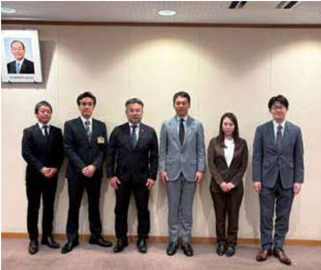
▲三浦市長と新正副会長一同で記念撮影