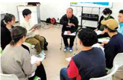
▼過去のイベントの様子▲

今後も、多世代が交流し、新たなつながりや挑戦が生まれる場として、多くの皆さまに親しまれる施設を目指してまいります。