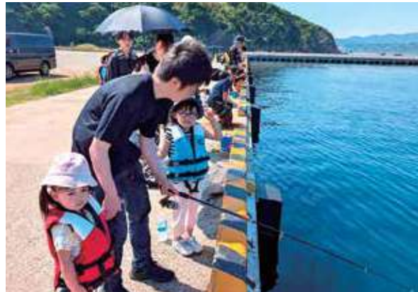
◀ 家族で釣り体験を楽しむメンバー

家族ぐるみの交流を通じて、メンバー同士の絆をさらに深める有意義な一日となりました。ご参加いただいた皆さま、そしてご協力いただいたかめや釣具のスタッフの皆さまに心より感謝申し上げます。