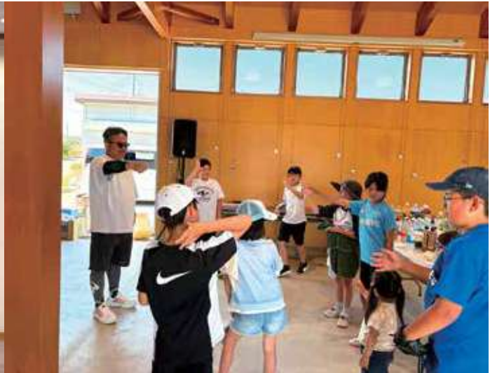
▲メンバー家族とふれあう高野会長